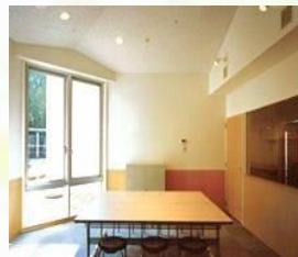
様々なプログラムを実施しています。